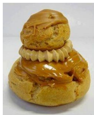
religieuse au café